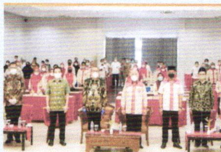
AMPINGI GUBERNUR DALAM ENGUKUHAN PERHIPTANI KALBAR