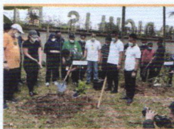
MENTAN RI TANAM LPUKAT LILIN SINGKAWANG