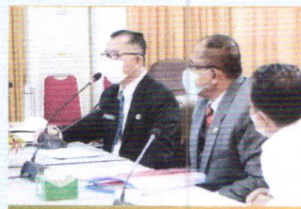
GD PELUANG EKSPOR RODUK HORTIKULTURA

DINAS TANAMAN PANGAN DAN HORTIKULTURA PROVINSI KALIMANTAN BARAT 2022