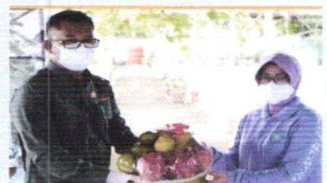
UNJUNGAN TP PKK KALBAR KEBUN EDUKASI DINAS TPH KALBAR