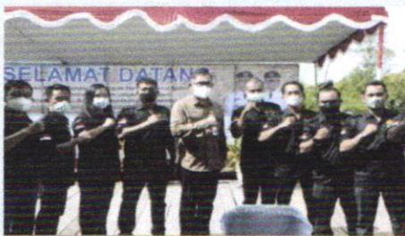
ADIS TPH KALBAR BERSAMA EMUDA PETANI BERKEMAJUAN